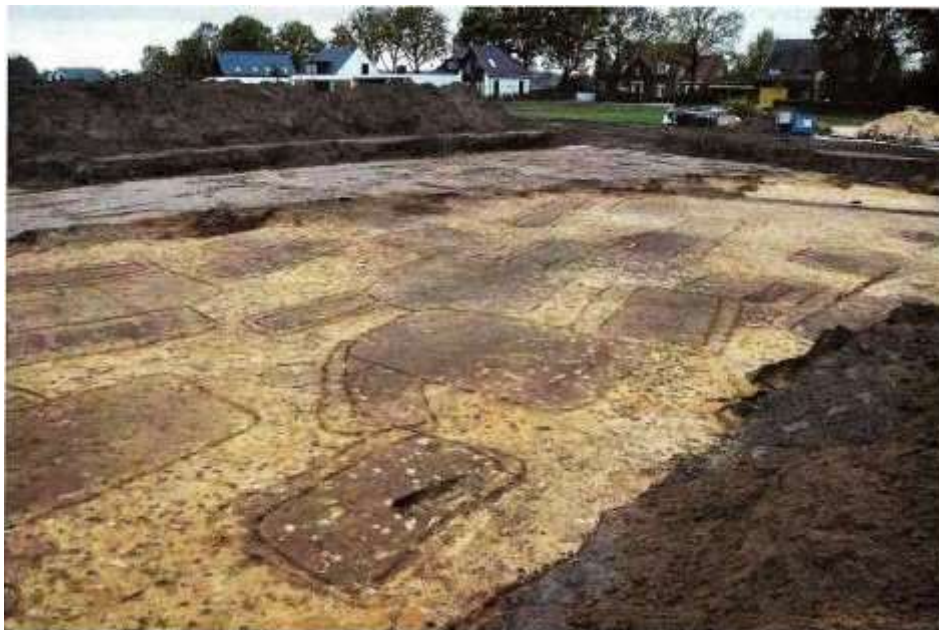
Graven tekenen zich af als donkere rechthoekige Wakken