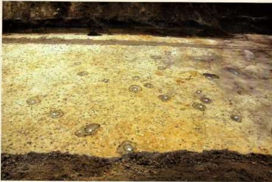
Paalsporen van vermoedelijk een vroeg middeleeuwse boerderij