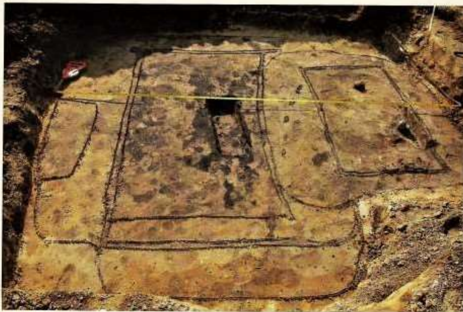
Kamergraf met wapengraf van man (links) en vrouw (rechts)