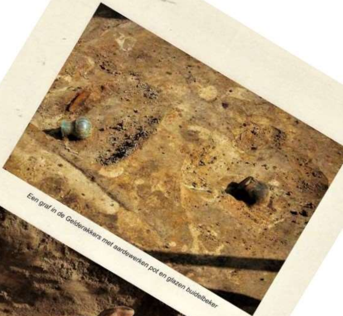
Een graf in de Gelderakkers met aardewerken pot en glazen buidelbeker