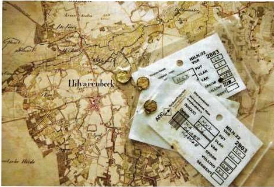
Opgravingsterrein in het Spul op een topografische kaart van circa 1840. Opgravingsterrein in het Spul op een topografische kaart van circa 1840. Op de kaart liggen drie opgegraven gouden hangers.