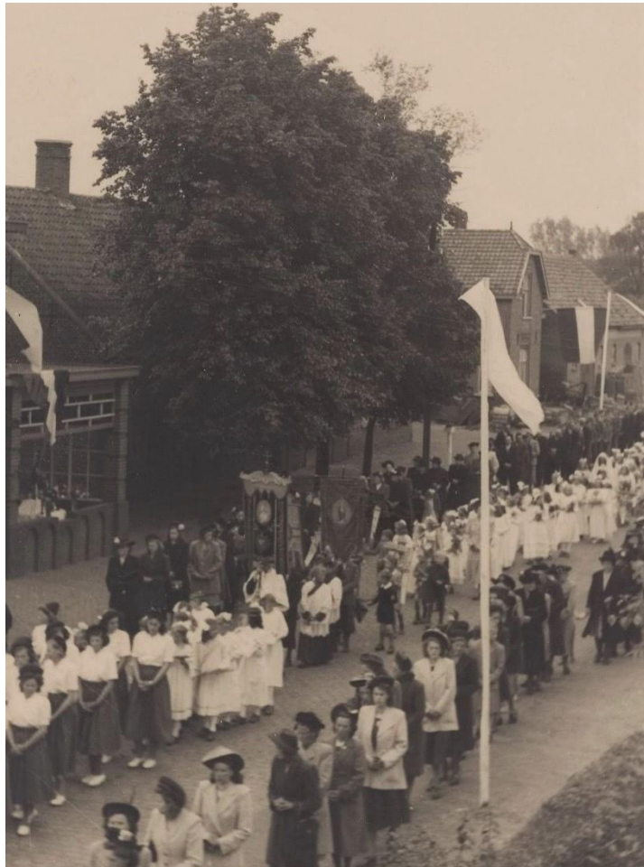
Processie tijdens het Rijke Roomsche Leven in Diessen in de Julianastraat

De Oude Pastorie met bijbehorende boerderij aan de Reusel in 1830