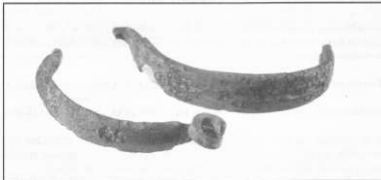
Romeinse kleedspelden (fibulae), opgegraven in Diessen op 25 oktober 2001

Recentelijk werd nog opgemerkt dat voor het gebied waar heden ten dage het gemeenschapshuis Hercules staat, tegenover de Zijthorst, in de tijd voor 1795, het toponym 'Steenakker' gebezigd zou zijn. Dit gegeven moet nog geverifieerd worden, maar als dat zo is zou het veel verklaren!