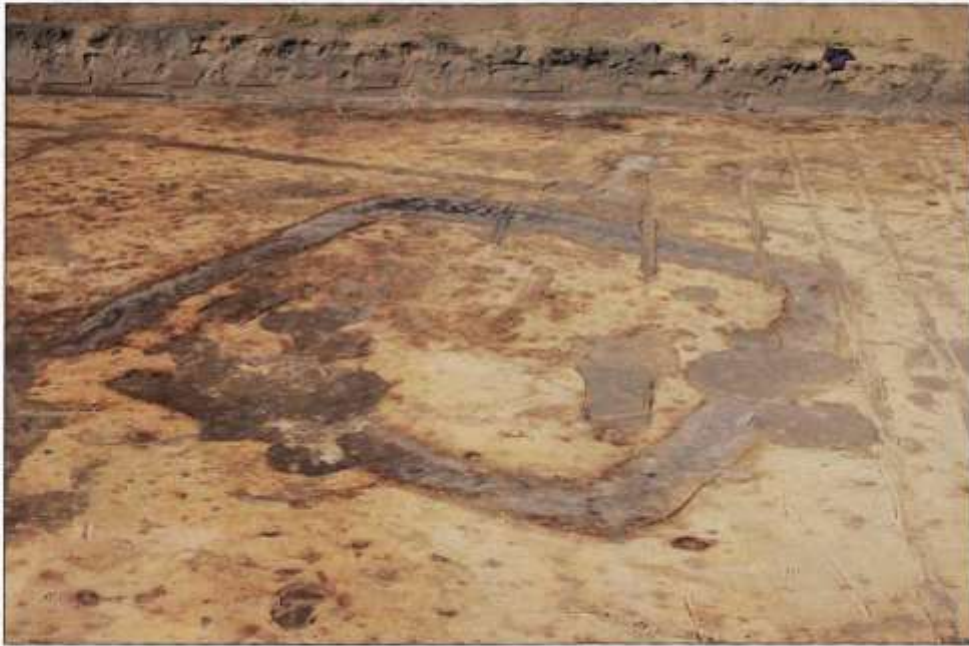
De meest bijzondere vondst bij opgravingen in de Vroonacker was een vierkant crematiegraf uit de 5 e of 6 e eeuw v. Chr.

In 1995 vindt het Instituut voor Toegepast Historisch Onderzoek bij de Alsie twee kuilen, die veel houtskool bevatten, ze dateren van de IJzertijd. Dat geldt ook voor een 10 tot 30 cm beige-keurige akkerlaag, die scherven uit de Late IJzertijd (200-0 voor Chr.) bevat. Bovendien is veel huttenleem gevonden, waaruit blijkt dat bewoningssporen in de directe omgeving te vinden zijn. De zuidkant van de Alsie wordt Zandligt genoemd. Over een groot gebied zijn hier ontzandingskuilen gegraven. Dit zand is onder meer gebruikt om op de vloer te strooien. Deze kuilen uit de Late Middeleeuwen hebben alle mogelijke sporen uit de IJzertijd verstoord.