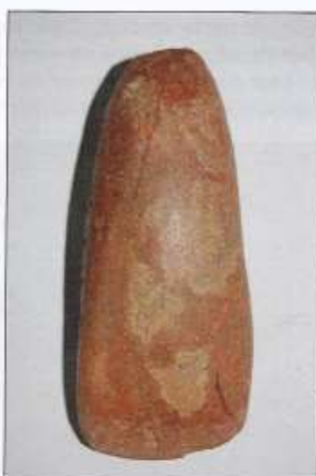
Links een stenen bijl die gevonden is in het Hoekje, rechts een bijl uit Haghorst.

Mogelijk is dit voorhistorisch gebruik gekerstend. Nadat de akker was ingezaaid plaatste de boer op de vier hoeken met de greep van zijn schop een kruisteken om Gods zegen af te smeken. Op palmzondag werd een gewijd palmtakje op de vier hoeken van het perceel in de grond gestoken. Stenen bijlen stammen uit de Nieuwe Steentijd (ca 4400-1700 voor Chr.). In deze periode zien we dat de jagende mens zich op een plek vestigt en zelf voedsel gaat produceren door het domesticeren van dieren en graansoorten. Ook maken ze voor het eerst aardewerk. Deze overgang van jager naar boer wordt als een van de grootste revoluties van onze geschiedenis bestempeld. Natuurlijk is die overgang zeer geleidelijk gegaan, nog honderden jaren hebben jagers en boeren naast elkaar geleefd. Uiteindelijk hebben de jagers-verzamelaars toch voor het boerenbestaan gekozen. Waarom is niet duidelijk. Werden hun jachtgronden steeds kleiner, was een permanente behuizing aantrekkelijk of gaf het boerenbestaan meer aanzien?