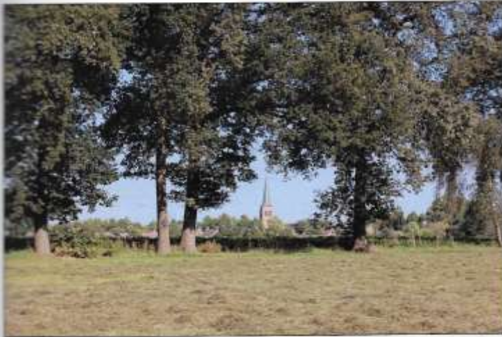
Foto boven: bolle akker op de schildvormige es bij Diessen. Rechts een doorsnede van een bolle akker. Goed is te zien dat boven op de gele grond door plaggenbemesting een donkere laag is ontstaan, geschikt voor de landbouw.

Deze bolle akkers zijn ontstaan door heideplaggen te mengen met de mest van dieren en deze op de akkers te verspreiden. De bolle akkers zijn de oudste landbouwgebieden. In Haghorst waren dat de Hooge en Lage Haghorst, Aan de Drie Huizen en de Haghorstse Nieuwe Erven. In Baarschot de Troosten, de Braken, de Kelderik, de Goudberg, het Gijsleind, de Kroppen en Baarschot later de Heikant genoemd. In Diessen de Heuvel, de Alsen, het Schildeke, de Lange Akker, het Laar, het Sprekeleind, Nieuwe Erven en het Elder.