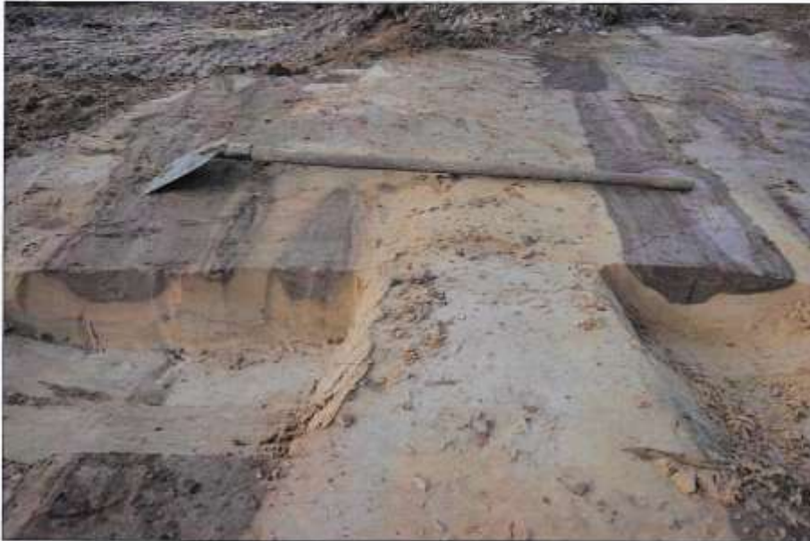
Bij de opgraving werden karsporen zichtbaar van het Holepad. Dat duidt erop dat het pad een veelgebruikte route was. Hole betekent 'holle', een weg tussen bolle akkers.

in die tijd en heeft vermoedelijk een symbolische betekenis; de opening in het zuidoosten correspondeert met de richting waar de zon opkomt. Er was geen urn in het graf aanwezig, waarschijnlijk zijn de verzamelde crematieresten in een doek begraven. Om het graf lag een zogenaamd langbed van ca. 80 m lang. In het zuiden van het langbed, ongeveer halverwege, lag een rechthoekige kuil met daarin veel houtskool, een verpulverde kraal van blauw glas en crematieresten. Waarschijnlijk is de dode op die plek gecremeerd. Deze langbedden komen ook voor in het 1 km westelijker gelegen urnenveld in het Laag Spul. Het is niet onmogelijk, dat op de Vroonacker ook een urnenveld ligt. Dat zou ten noorden en westen van het crematiegraf moeten liggen. Deze urnenvelden lagen meestal aan een oude route. Hier betreft het Holepad (i.c. holle weg tussen bolle akkers). Ook de latere bewoning uit de Merovingisch-Karolingische tijd oriënteerde zich op dit pad.