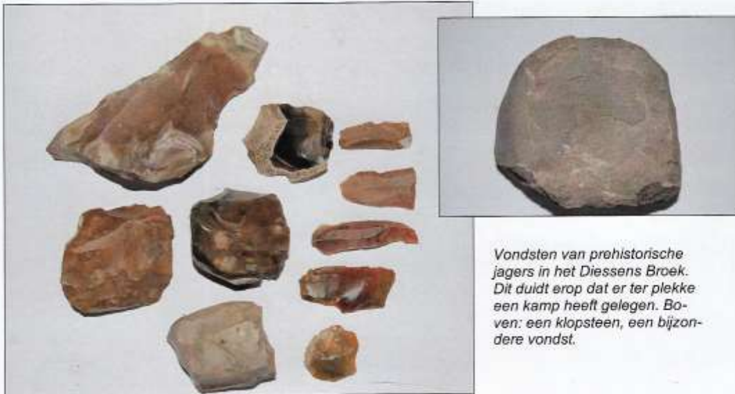
Vondsten van prehistorische jagers in het Diessens Broek. Dit duidt erop dat er ter plekke een kamp heeft gelegen. Boven: een klopsteen, een bijzondere vondst.

Met de klopsteen werd een stuk van een vuursteenknol afgeslagen. Van dit stuk werden repen of klingen afgeslagen, die vervolgens van een scherpe kant werden voorzien. Het zogenaamde retoucheren. Dit gebeurde door kleine stukjes van de rand af te slaan of de rand op een stenen aambeeld te drukken. Zo fabriceerde men pijlpunten, boortjes, krabbers en messen. Vervolgens werden ze in een steel van hout of gewei gemonteerd met behulp van houtteer, gemaakt van berkenbast, dat verhit werd.