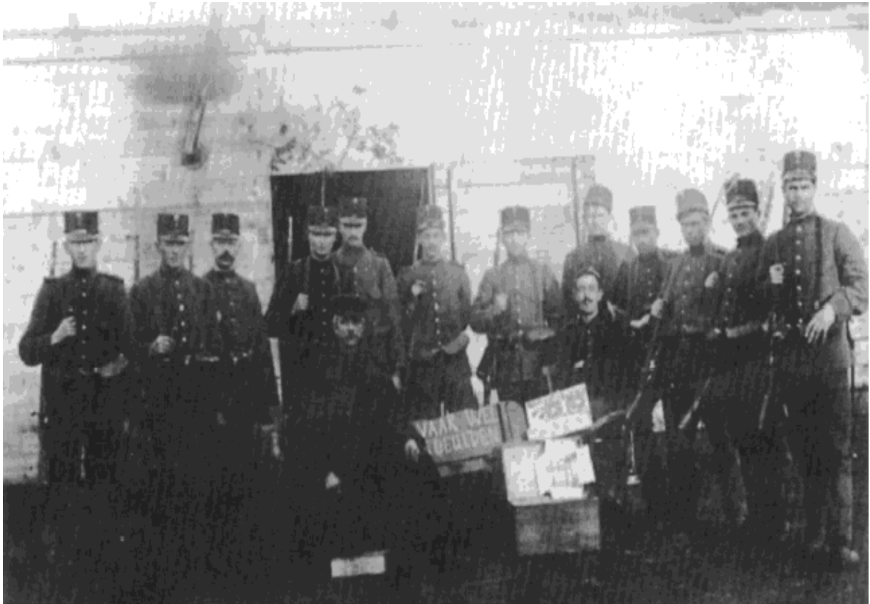
De Nederlandse grenswacht op Tulder gedurende de Eerste Wereldoorlog