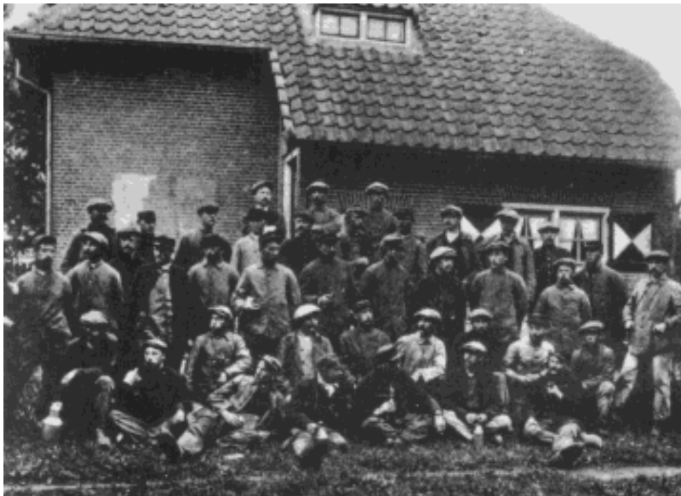
Belgische militairen, geïnterneerd in Nederland, waren massaal werkzaam op Landgoed De Utrecht