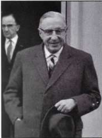
Jan de Quay was van 1946-1959 Commissaris der Koningin in Noord-Brabant. Daarna was hij onder meer minister-president.